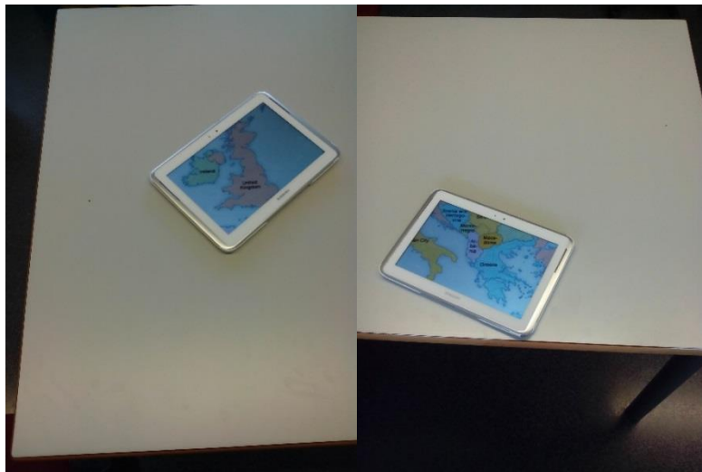
Fig. 3. Aplicación prototipo que consiste en la exploración de un mapa 2D “oculto” en la mesa. La tableta se ha movido de una posición a otra en la mesa, mostrando dos porciones del mapa distintas.

Hemos realizado una primera implementación del sistema descrito sobre dispositivos móviles (ver Fig. 2 ). El prototipo en cuestión permite la exploración colaborativa de un mapa 2D que se encuentra “oculto” en la mesa de trabajo (ver Fig. 3 ).