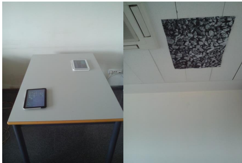
Fig. 2. Instalación con dos tabletas sobre la mesa (izquierda) y la imagen de referencia en el techo justo arriba de la misma (derecha).

El diseño de WeTab es similar al propuesto por Maciel y otros [15] pero con dos diferencias fundamentales. En aquel trabajo los dispositivos utilizados eran TabletPCs (sin capacidad de interacción multitáctil) y las imágenes de referencia eran marcadores fiduciales. En este sentido, el número de marcadores o identificadores diferentes existentes limita el número de mesas de este tipo que se pueden construir en un mismo espacio de juego y el tamaño de las mismas. Nuestro sistema tiene la ventaja de