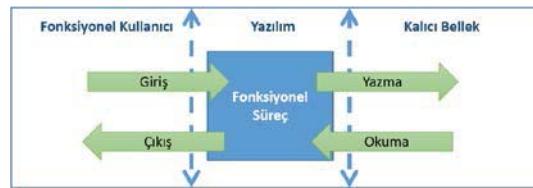
Şekil 1 - COSMIC Veri Hareketleri

Veri hareketleri belirlendikten sonra tüm fonksiyonel süreçlere ait veri hareketleri toplanarak yazılımın COSMIC Fonksiyon Nokta sayısı bulunmuş olur (Formül (1)).