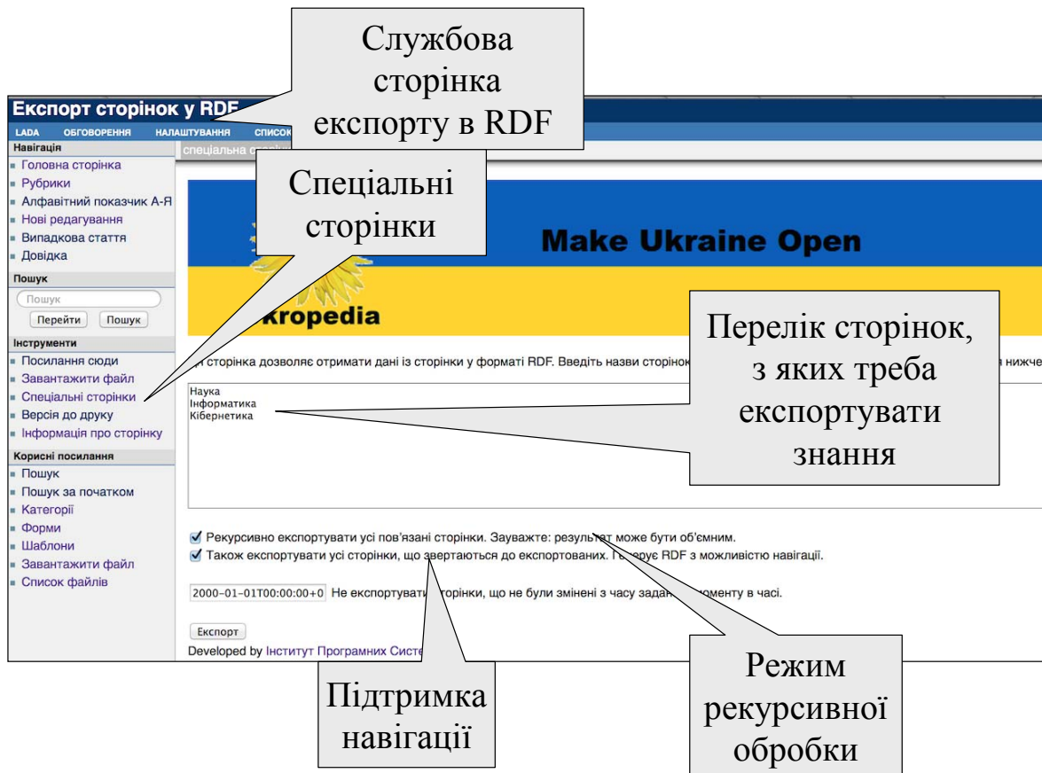
Рис. 2. Побудова RDF-файла за семантично розміченими Wiki-сторінками