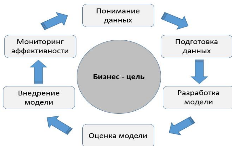
Рис.1. Подходы к внедрению инструментов предиктивной аналитики

Аналитики Gartner полагают, что дальнейшее развитие мирового рынка бизнес-анализа пойдет по пути активного освоения продвинутой аналитики (advanced analytics), в том числе – предиктивного анализа, построения симуляторов и вариативных моделей. Как видно из схемы, предложенной компанией Forrester research (рис.1), подходы к внедрению инструментов предиктивной аналитики подразумевают непрерывный цикл обработки данных, превращающих их в знания, что хорошо согласуется с требованиями цифровой экономики.