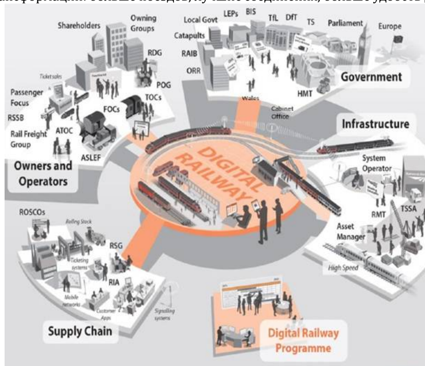
Рис 3. Взаимоотношения программы цифровой железной дороги Великобритании с другими частями экономики страны

По мнению основоположников перехода к цифровым железным дорогам в Великобритании, цифровая железная дорога имеет одну главную цель - устойчивый рост экономики Великобритании за счет ускорения цифровой модернизации железной дороги. Это приносит трансформационные преимущества и сложности в безопасность, объемы, стоимость, производительность, удобство клиентов и положительные воздействия на окружающую среду. Всего было объявлено три задачи (цели) этой трансформации: больше поездов, лучшие соединения, больше удобств для клиентов.