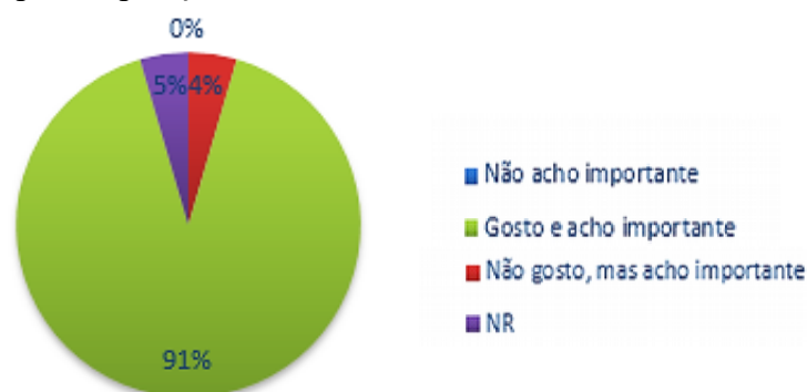
Figura 1. A importância das tecnologias digitais, segundo os professores.

Quando questionados se conhecem os dispositivos tecnológicos da escola em que atuam, 22,73% disseram que não conhecem e 77,27% afirmam positivamente e que, inclusive, já utilizaram ou utilizam em suas aulas a TV, o aparelho de DVD, caixa de som, e o projetor para exposição do conteúdo.