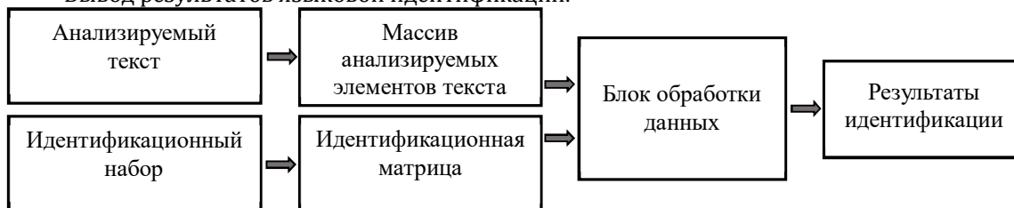
Рис. 1. Упрощенная блок-схема работы определителя языка текста

При этом программа должна учитывать письменную систему, лексические и грамматические особенности языков, различия в диалектах, форматы ввода и вывода информации, особенности способов идентификации, недостатки языковых моделей и множество других факторов. Качество идентификации и эффективность языкового определителя зависят от выбора способа языковой идентификации и его технической реализации. Основой всего процесса идентификации является набор идентифицирующих элементов – идентификационных маркеров, на базе которого генерируется идентификационная матрица, содержащая ассоциативные связи маркеров с конкретными языковыми группами, вариантами, языками и диалектами, а также другие характерные параметры. В этой статье подробно рассмотрены возможные модификации и логическая структура такого набора, а также его техническая реализация с указанием особенностей каждого технологического решения. В качестве основы языковой идентификации выбран один из лингвистических способов [3], позволяющий определять языковую принадлежность по формам предикатов [4], где в качестве идентификационных маркеров обычно используются формы глаголов. Это позволит наиболее наглядно продемонстрировать вариации идентификационного набора и возможности его оптимизации.