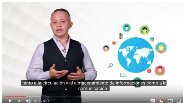
Fig. 1 Ejemplo de video del MOOC

presentación del profesor, así como los recursos necesarios para iniciar el proceso de aprendizaje (descripción del curso, programa, acerca del profesor, tutorial de navegación, foro de bienvenida y foro de consultas). Cada lección estuvo conformada por videos subtitrados (ver figura 1), documentos de apoyo con información adicional para complementar los contenidos y al finalizar se encontraban los cuestionarios de corrección automática.