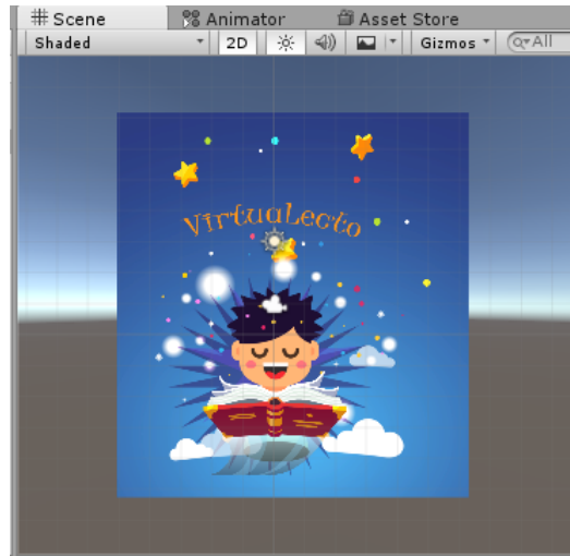
Figura 2. Vista del desarrollo de la escena de introducción a la aplicación

Cada libro de aventura mostrara una recreación del escenario por capítulos leídos propios de la lectura, a continuación se visualizará dos aventuras desarrolladas en UNITY, cada aventura con 7 capítulos.