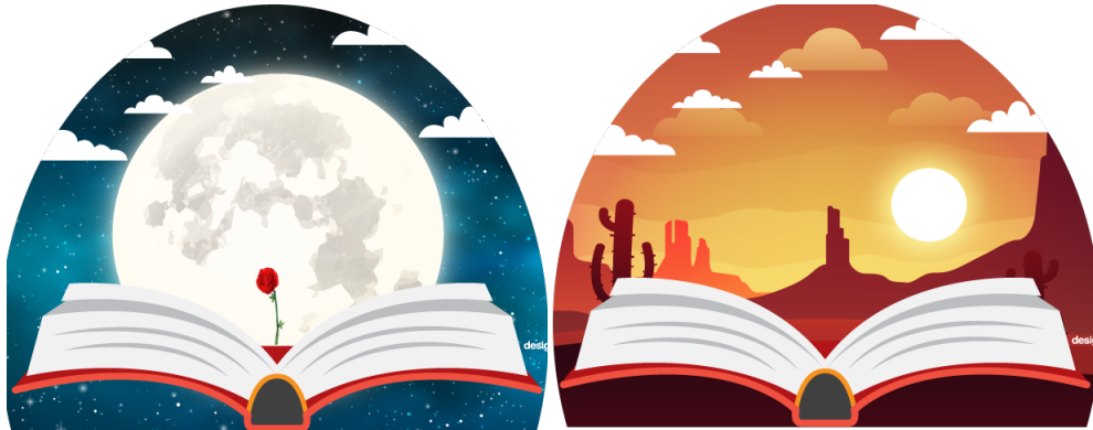
Figura 3. Vista de aventuras para la lectura El Principito

Al abrir un libro de aventura lo que continuará son los cuestionarios, el estudiante previa lectura, ahora contestará las preguntas, visualizaremos a continuación el desarrollo de los cuestionarios en UNITY y el resultado final le mostrará el diseño 3D como factor de motivación.