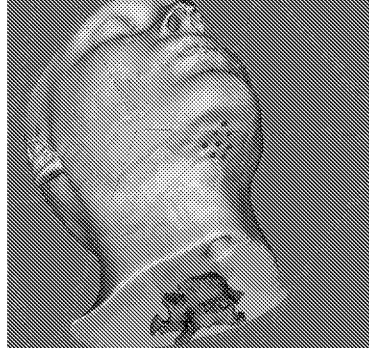
Abb. 2. Virtuelle Planung der Brachytherapie. Nach Segmentierung des Tumors werden die Einstichstellen der Brachytherapienadeln sowie deren Zugangsweg unter Berücksichtigung eventueller Risikoorgane definiert.

Patienten in den Planungsdaten abzugleichen (Abb. 1). Die präoperativ festgelegten Planungsdaten (Abb. 2) können mit einem Videoprojektor direkt auf dem Patienten sichtbar gemacht werden. Dabei kann sowohl auf Markerschrauben zur Registrierung als auch auf eine Fixierung des Patienten verzichtet werden, wobei dessen Bewegungen über aufgeklebte passive Marker nachverfolgt werden. Die Genauigkeit der Projektion beträgt derzeit \pm 1 mm ohne und \pm 3 mm mit Nachverfolgung der Patientenlage, während der Operationsplan momentan mit 0.5 Hz nachgeführt werden kann. Die Möglichkeit der Patientenreferenzierung über den Oberflächenscan erlaubt es die aktuelle Patientenlage digital zu erfassen. Damit sind sowohl die reale als auch virtuelle Lage des Patienten in digitaler Form vorhanden und können miteinander abgeglichen werden. Der Videoprojektor ermöglicht es die Planungsdaten nach Anpassung auf die aktuelle Patientenlage auf die Patientenoberfläche zu projizieren. So können sowohl Einstichpunkte der Brachytherapienadeln, wie auch Tumor- und Risikostrukturen und ihre Lokalisation während der Operation auf der Patientenoberfläche bereitgestellt werden (Abb. 3).